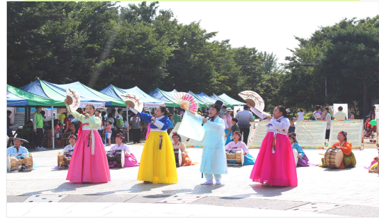
진주국악무용동호회관 국악 및 입춤 공연