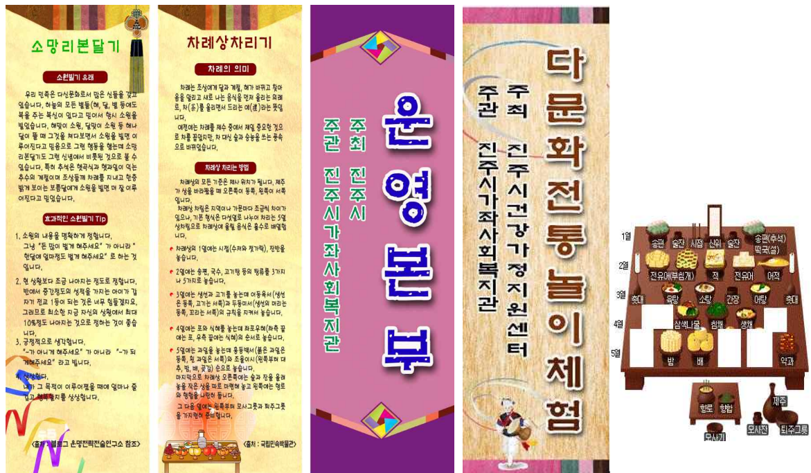
<각 부스 현수막>