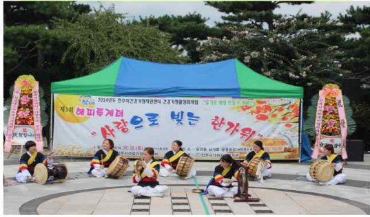
진주교육대학 '쌍풀이놀이패' 공연