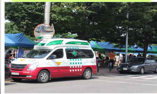
응급차 긴급 대기