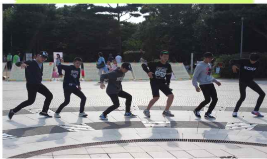
청소년 수련관 댄스팀 공연