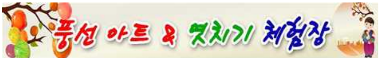
<부스 안내 현수막>