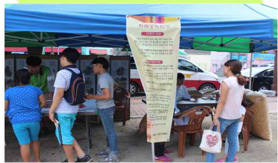
바른 차례상 차리기 게임