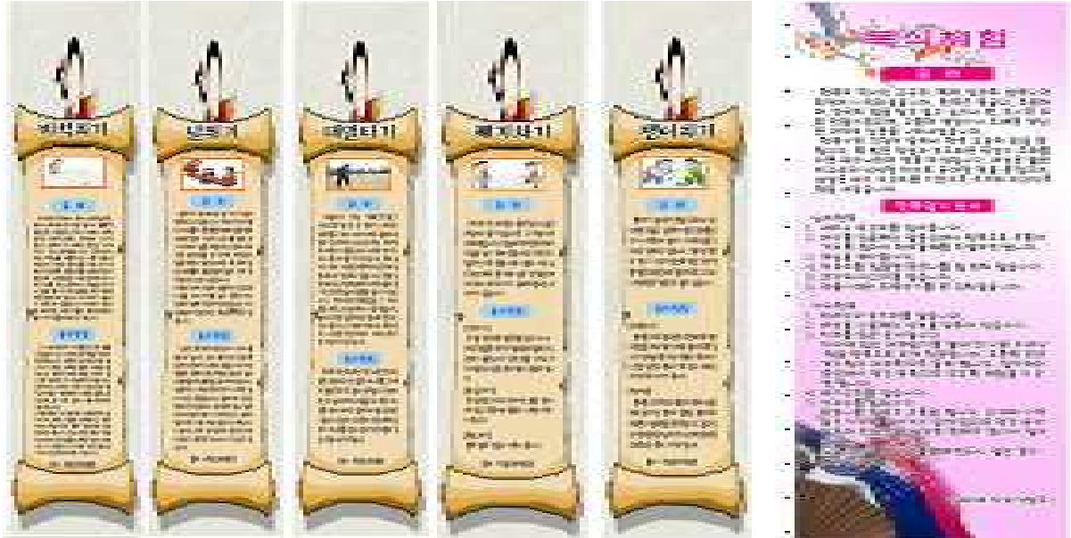
<전통놀이 체험 현수막>