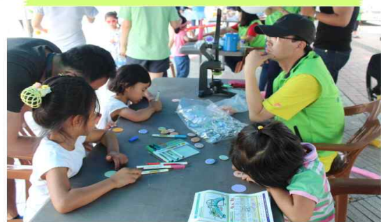
가족사랑 뱃지 만들기