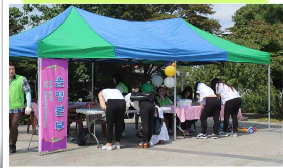
운영 본부 및 캠페인 풍선 나눔