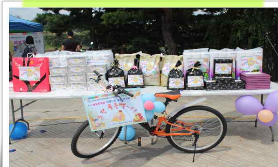
한가위 도전골든벨 상품