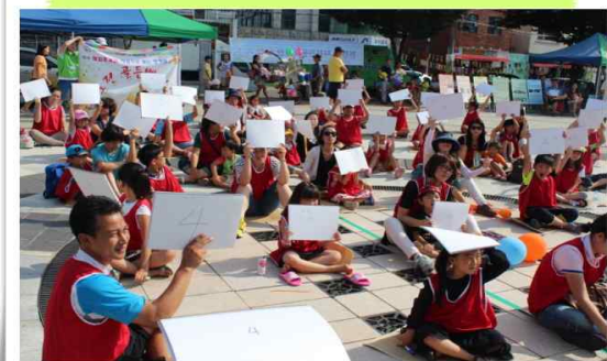
한가위 도전 골든벨~!