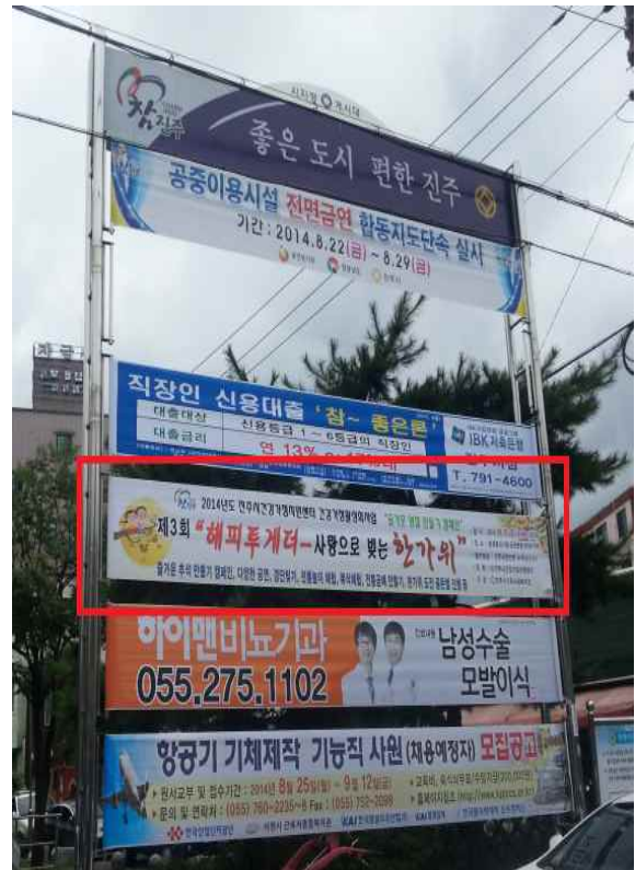
장대동 어린이놀이터 홍보