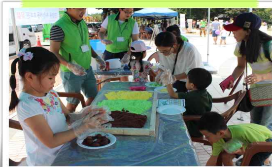
색색의 경단 빚기