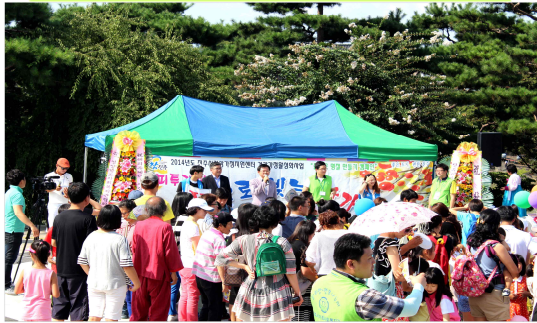
행사 내빈 소개