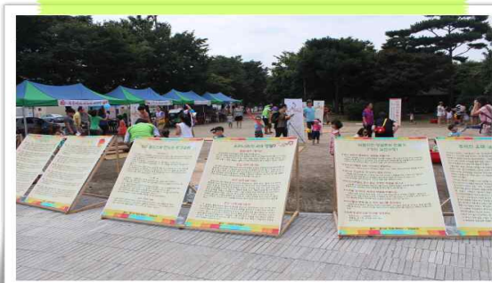
즐거운 명절 만들기 캠페인 현수막 전시